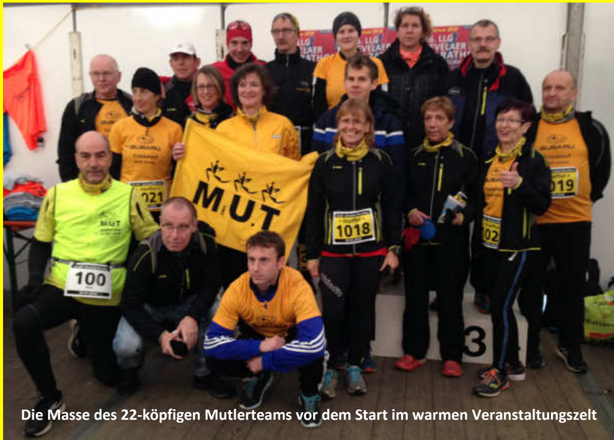
Die Masse des 22-köpfigen Mutlerteams vor dem Start im warmen Veranstaltungszelt

Troisdorf, Kevelaer – Es ist gute Tradition, dass das Marathon- und Ultrateam der Troisdorfer LG beim Kevelaer-Marathon dabei ist. Die Veranstaltung, die zumeist am ersten Sonntag nach Neujahr stattfindet, ist ein willkommener Auftakt für das Wettkampfsjahr.